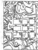
Via G. Amendola