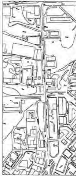
Via Riccardo Da Lentini