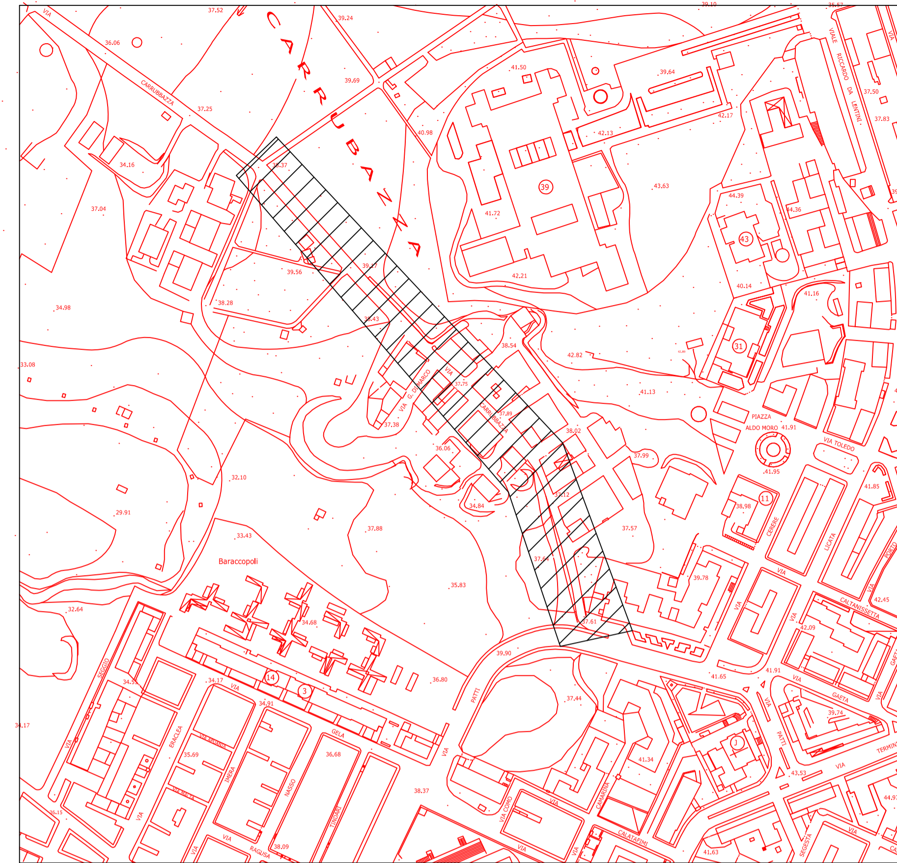
STRALCIO AEROFOTOGRAMMETRICO CON EVIDENZIAMENTO AREA DI INTERVENTO