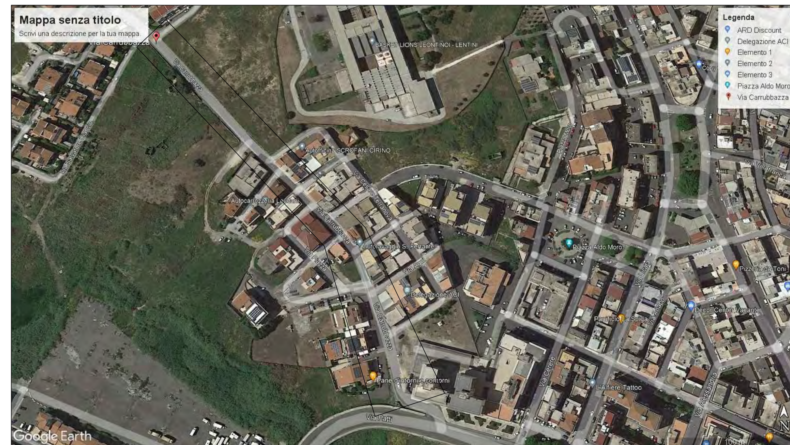
FOTO AEREA CON EVIDENZIAMENTO AREA DI INTERVENTO