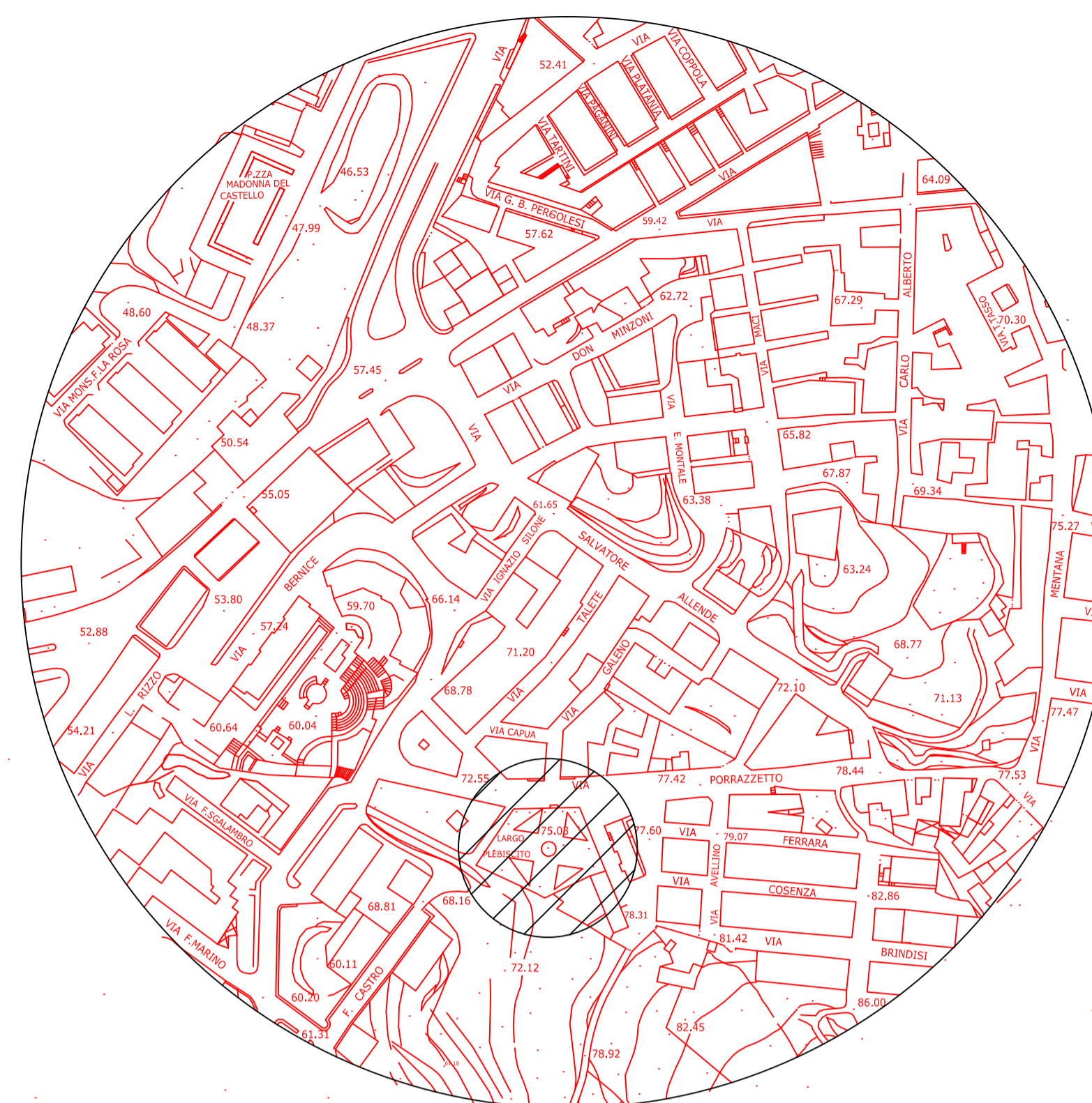
STRALCIO AEROTOTOGRAMMETRICO CON EVIDENZIAMENTO AREA DI INTERVENTO